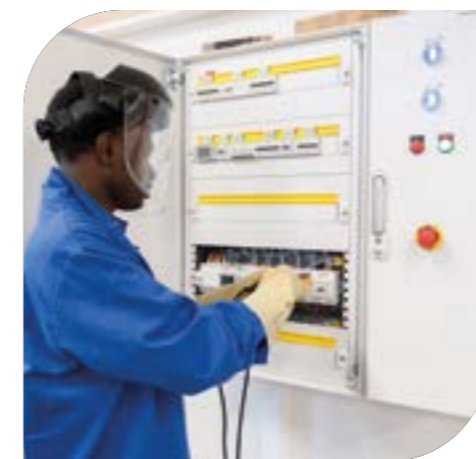
Jeune en filière industrielle (partenariat avec Eiffage Énergie et Systèmes) au lycée Gabriel-Péri