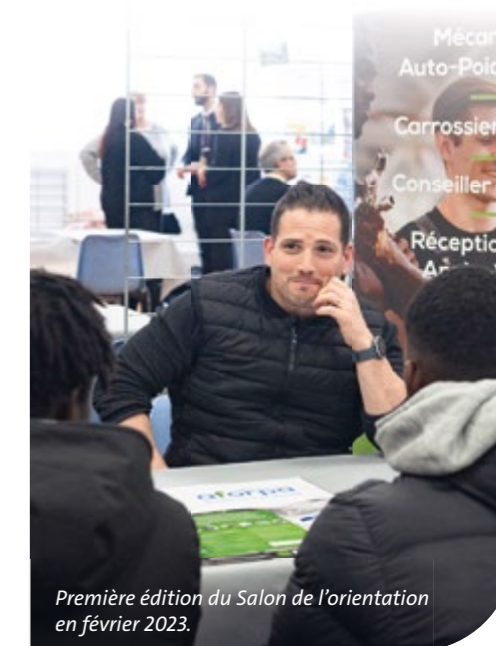
Première édition du Salon de l'orientation en février 2023.

La ville et ses partenaires organisent la 2 e édition du Salon de l'orientation les 18 et 19 janvier prochains, de 9h à 17h, à l'hôtel de ville. Destiné en priorité aux classes de 3 e et 4 e des six collèges campinois, ainsi qu'aux 1 res et terminales des quatre lycées du secteur, cet événement sera également ouvert au public. De stand en stand, les jeunes Campinois pourront découvrir les filières locales (lycée et post-bac) et les centres de formation (l'école de Paris des métiers de la table, l'AFANEM, les Compagnons du tour de France...), les métiers (dont ceux de la Fonction publique territoriale), mais aussi le service civique et le service national universel. Diverses entreprises seront également présentes, dont Enedis, Disney et Aurion.