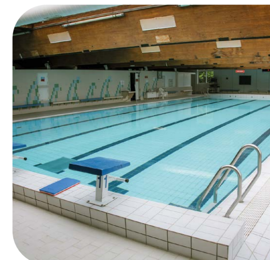
Projet de rénovation et réouverture de la piscine Jean-Guimier, au Bois-l'Abbé

Voie, équipements, patrimoine... : des rénovations qui changent tout! La voirie se réinvente partout en ville (rue de la Plage repensée, rue Marie végétalisée) et les connexions entre quartiers se renforcent progressivement. Dans les écoles, le plan d'urgence se poursuit : fin des travaux à Henri-Bassis, lancement à Jacques-Solomon et Eugénie-Cotton. La piscine Jean-Guimier sera rénovée et rouvrira, une troisième Maison pour tous sera inaugurée aux Quatre-Cités. Enfin, l'église Saint-Saturnin (XII e siècle) sera restaurée avec le soutien de partenaires et d'une souscription citoyenne.